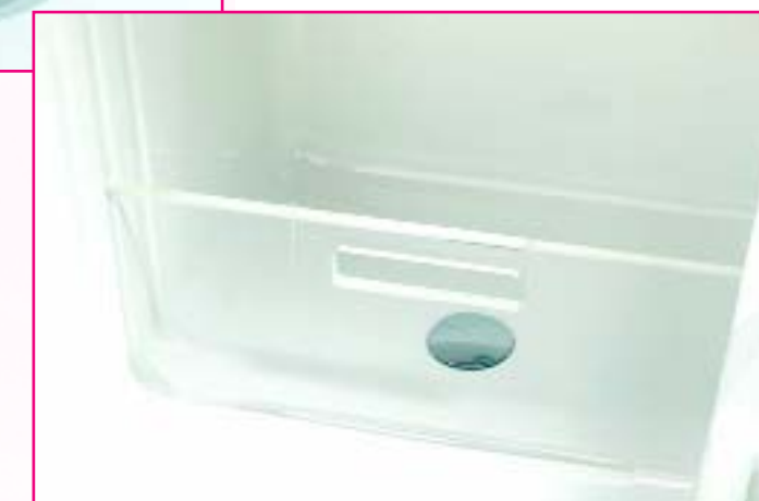
LENA 230 der Pflegeprofi für „große“ Aufgaben. Auch mit Füllstop, Desinfektion und Hydromassage-einrichtung, Länge 230 cm.