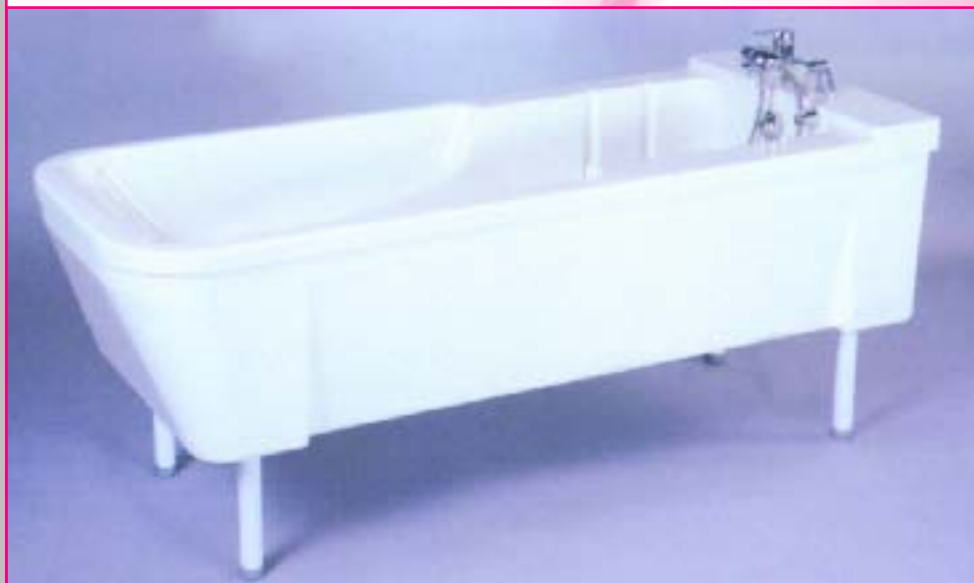
Stationswanne Standard. Als Standwanne die ideale Ergänzung zur Hubwanne. Erhältlich in verschiedenen Arbeitshöhen und 3 wählbaren Mischbatterien.