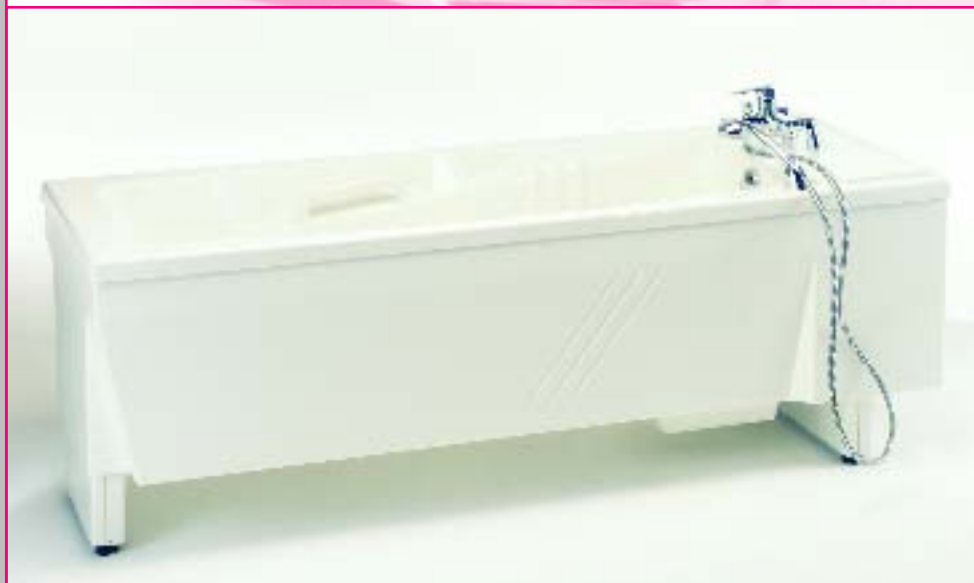
LENA 100 die preiswerte Alternative für die Grundausstattung. Auf Wunsch auch mit Thermostadmischbatterie.

Baden entspannt Körper und Seele – erst recht, wenn man mit einer körperlichen Einschränkung leben muss. Dem Pflegebedürftigen die Angst vor einer Pflegewanne zu nehmen war Ansporn für die Entwicklung der Hubwanne LENA. Im Aufbau und Design der Wanne wurden Bedürfnisse des Anwenders und des Pflegers umgesetzt. Professionelle Technik und das Aussehen einer Badewanne wie zu Hause, tragen zu einem harmonischen Umfeld im Pflegebad bei. Eine solide und störungsfreie Technik, sowie einfachste Handhabung sind der Garant für sicheres und kostengünstiges Arbeiten. Von der Standwanne über die Hubwanne bis hin zum Pflegebad mit Hydromassageeinrichtung – alle Variationen sind kombinierbar.