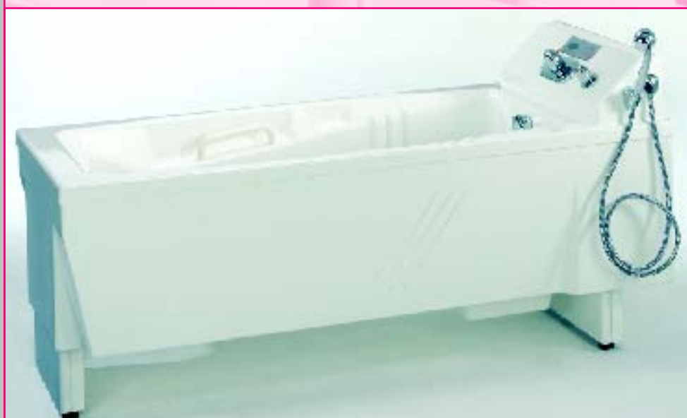
LENA 200 die „Kleine“ für den Pflegealltag. Mit einer Länge von 200 cm auch in engen Pflege-bädern ganz groß.